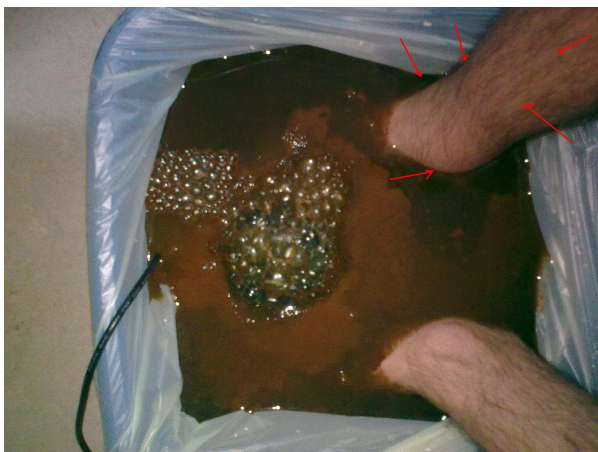
Detox 1 – Do 04.08.2011 - 18.30 Uhr Bild 1