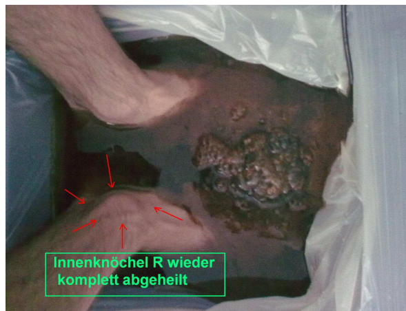
Detox 3 – Mo 08.08.2011 - 10.00 Uhr