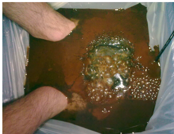
Detox 1 – Do 04.08.2011 - 18.30 Uhr Bild 2