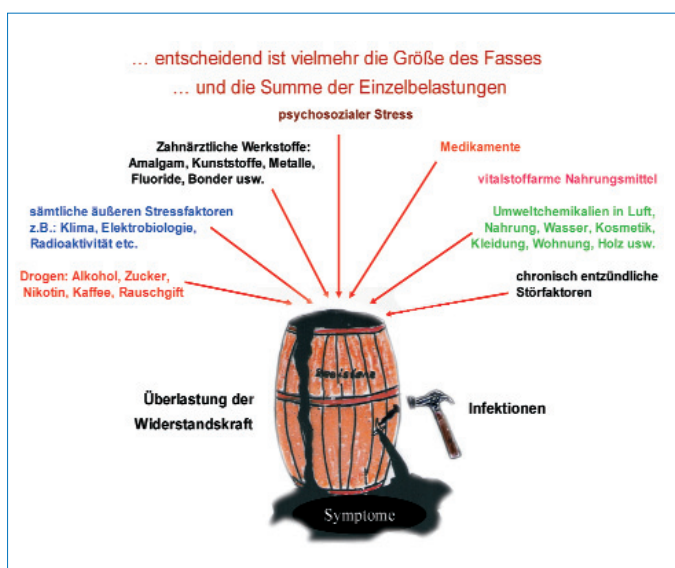
Abb. 2: Nicht die Dosis macht das Gift ...

Ähnlich der Bioresonanztherapie ist mit SCIO auch eine Stabilisierung der Körpereigenregulation möglich. Diese kann auf Grund der apparativ erstellten VARHOPE-Daten zur Unterstützung der Therapie sehr individuell und zielge-